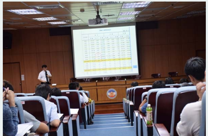
臺北地方法院檢察署高一書檢察官 講題：交通事故之偵查與法庭公訴實務